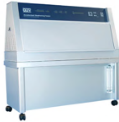
QUV 是全球使用最广泛的老化试验机

UVA-340 可最佳模拟太阳光中短波长紫外线。太阳辐照度控制系统可增强辐照度并加快测试进程